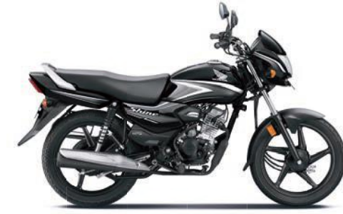
ग्रे के साथ ब्लैक

अभी ऑनलाइन बुक करें! www.honda2wheelerindia.com